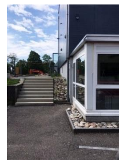
2 Eingang 1./2. Klassen

Wir werden die Eingänge mit Schildern gut kennzeichnen.